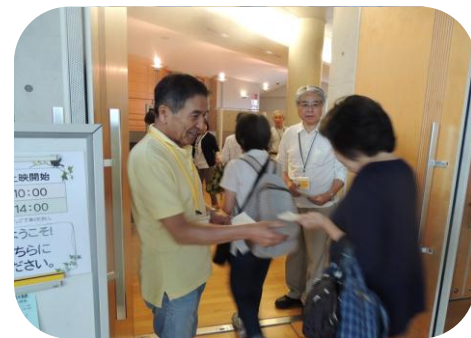
整理券を配布している様子

入り口で整理券を配るのが主な活動なので難しくない。まず何かを始めたいと思う人には気楽に参加できるボランティアだと思う。仲間も皆協力的で、和気あいあいとやっている。映画が大好きな方が見に来て下さり、その方たちとふれあう楽しさがこのボランティアの醍醐味だと思う。