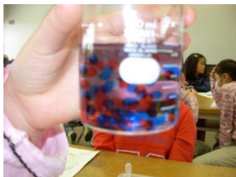
「レモン電池」と「人工イクラ」