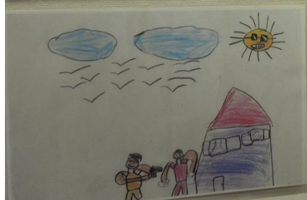
タイトル / メッセージ / 名前 // シンガポール