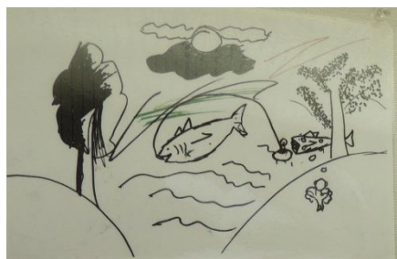
タイトル / メッセージ / 名前 Num 8歳 / 男性 ベトナム