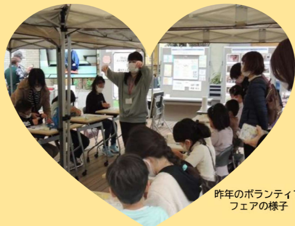
昨年のボランティアフェアの様子

詳しくは館内配布のチラシやホームページ、または学習支援担当(TEL: 207-5815)までお問合せください。