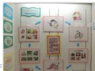
「生ごみリサイクル」 活動内容をパネルで紹介