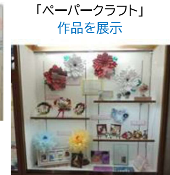
「ペーパークラフト」 作品を展示