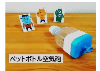
ペットボトル空気砲