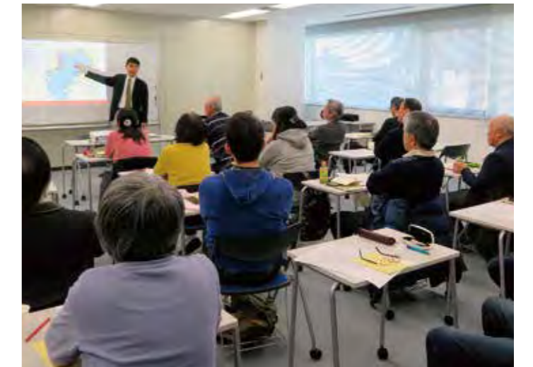
ちば学リレー講座:ちばの「新都市」～まかくはり変貌ストーリー～

座を開催しており、小学生から若者、主婦、シニア世代まで、幅広い世代の「学びたい」というニーズにきめ細かく応える学習機会を提供しています。