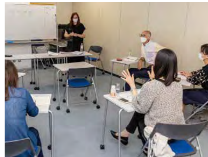
「ニキ先生の英会話(初級)」

す。また、新型コロナウイルス感染拡大防止として、講座を収録した動画によるオンデマンド配信も実施しています。