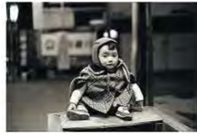
牛陽茂雄「幼年の「時間」」1980年頃 新潟市美術館蔵

本展覧会では、瀧口修造、阿部展也、大辻清司、牛陽茂雄の4人の作家の交流と創作をたどりながら、1930年代のシュルレアリスム写真から80年代のスナップショット的な「なんでもない写真」に至るまでの日本昭和写真史の断片をご紹介します。