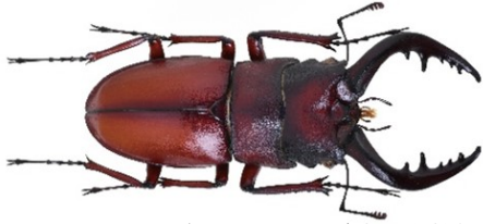
クロシマノコギリクワガタ (清水准教授が命名) Prosopocoilus inclinatus kuroshimaensis Shimizu et Murayama