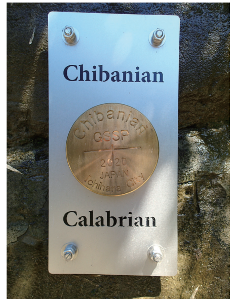
模式層であることを示すゴールデン・スパイク