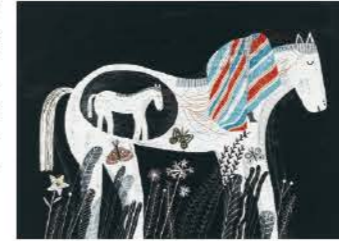
パロマ・バルレディピア(開いかげの本)2022年 ©Paloma Valdivia

スロバキア共和国の首都ブラチスラバで2年ごとに開催される世界最大規模の絵本原画コンクールから、チリ、ラトビア、中国など11人の受賞作品と、日本代表として選ばれた10組の作家の作品を紹介します。会期中には出品作家によるトークやライブペインティングも開催します。