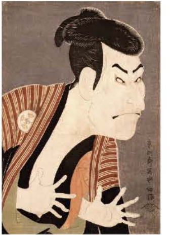
東洲斎写楽(三代目大台鬼次の江戸兵衛)寛政6年(1794)千葉市美術館蔵

2025年の大河ドラマの主人公である蔦屋重三郎は、18世紀なかばの江戸に新興の版元として出版界に彗星の如く現れ、斬新な作品を次々と世に送り出しました。本展では蔦屋重三郎が活躍した「浮世絵の黄金期」を中心に、鈴木春信や喜多川歌麿らの美人画、東洲斎写楽による役者絵を一堂に展覧。あわせて初期浮世絵から江戸時代後期までの名品を集め、浮世絵史も総覧します。