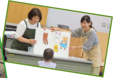
昨年の講座の様子